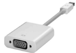
Mac 出力ケーブル 例